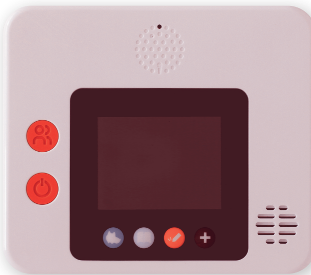
My English Pad